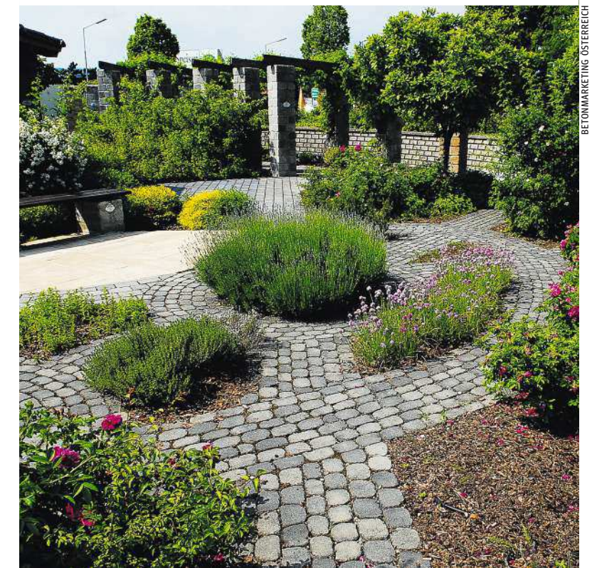
Umweltgerechter Wegebau, der Wasserdurchlässigkeit garantiert

weise und Planung entscheidend. Eine Studie, die die Vereinigung der Österreichischen Zementindustrie unter anderem gemeinsam mit der TU Wien Smart Minerals durchgeführt hat, hat den Umweltfußabdruck von Güterwegen aus Betonspur-, Kies- oder Schwarzbelagweg mittels der Ökobilanzierung untersucht und die Lebenszykluskosten dieser ermittelt. Der Ökobilanzvergleich der drei Güterwege zeigt, dass der Betonspurweg die umweltfreundlichste Option ist – sowohl in der Erosionsklasse 2 als auch in der Erosionsklasse 4. Dabei erweisen sich die lange Lebensdauer und die geringen Unterhaltsarbeiten als wesentlicher Vorteil. Beton ist eine aus Umwelt und Kostensicht sinnvolle Variante und wer im Sinne der Umwelt bauen will, kann bei der Materialwahl viel richtig machen.