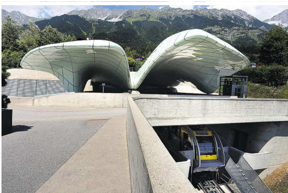
MICHAEL HERNER - BMO

Dachschale wurde mit einer starken plastischen Sichtbetonlandschaft verbunden. Durch den Kontrast der Materialoberflächen strahlen die freistehenden Schalenkonstruktionen eine besonders große Leichtigkeit aus. Gleichzeitig gelang es mittels lang geschwungener, sinusförmiger Sichtbetonbalustraden, den Bewegungsfluss der Besucherströme nachzuzeichnen.