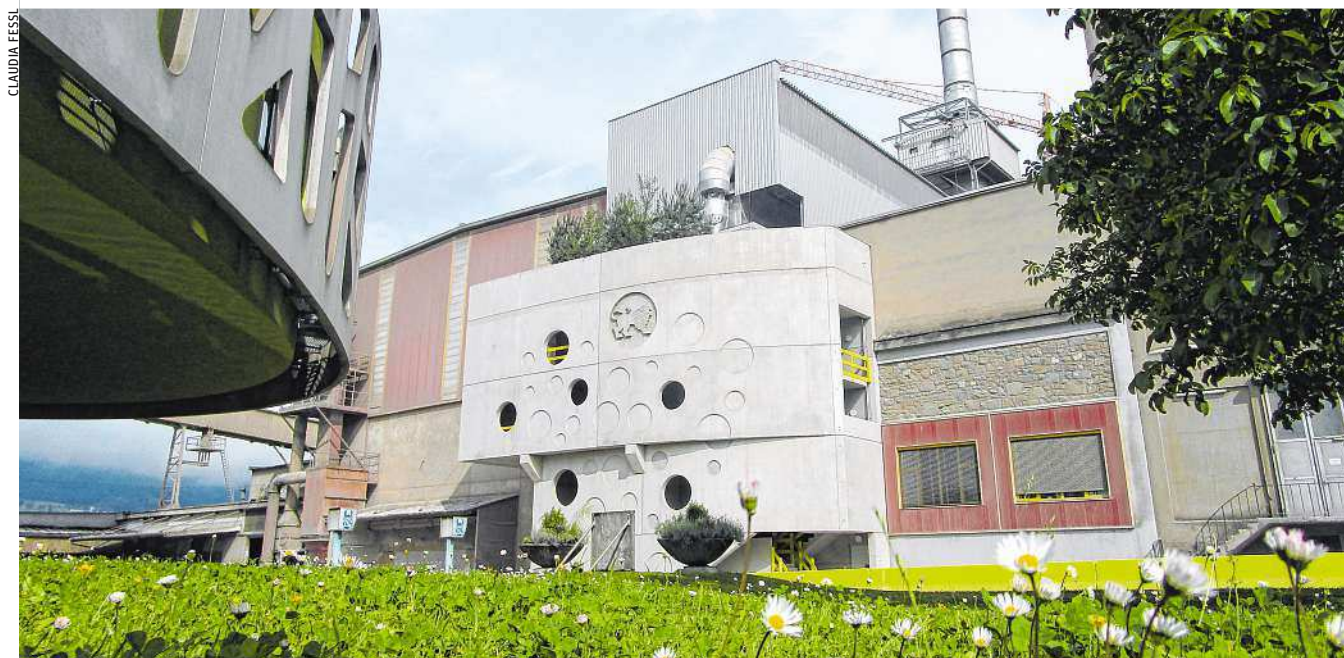
Die DeCONOX-Anlage verbindet industrielle Abluftreinigung mit Wärmerückgewinnung und versorgt 800 Haushalte mit Fernwärme