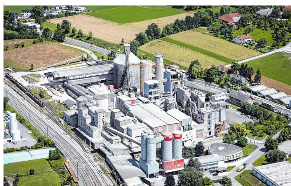
Zementwerke wie dieses in Kirchdorf sind um permanente Innovation bemüht

Die wesentlichen Ausgangsstoffe des Portlandzementklinkers sind Kalkstein, Ton und Mergel. Diese Rohstoffe werden in Steinbrüchen und Tongruben gewonnen, zerkleinert, zur Weiterverarbeitung ins Zementwerk transportiert und im sogenannten Mischbett zwischengelagert. Anschließend wird das Rohmaterial aus dem Mischbett entnommen, mit der Abwärme des Drehrohrofens getrocknet und gleichzeitig gemahlen. Der Mahlvorgang lässt das sogenannte Rohmehl entstehen, wobei das richtige Mischungsverhältnis der einzelnen Komponenten des Rohmehls laufend kontrolliert und korrigiert wird. Das Rohmehl wird anschließend in Silos homogenisiert, in einem Zwischensilo gelagert und für den Brenn-