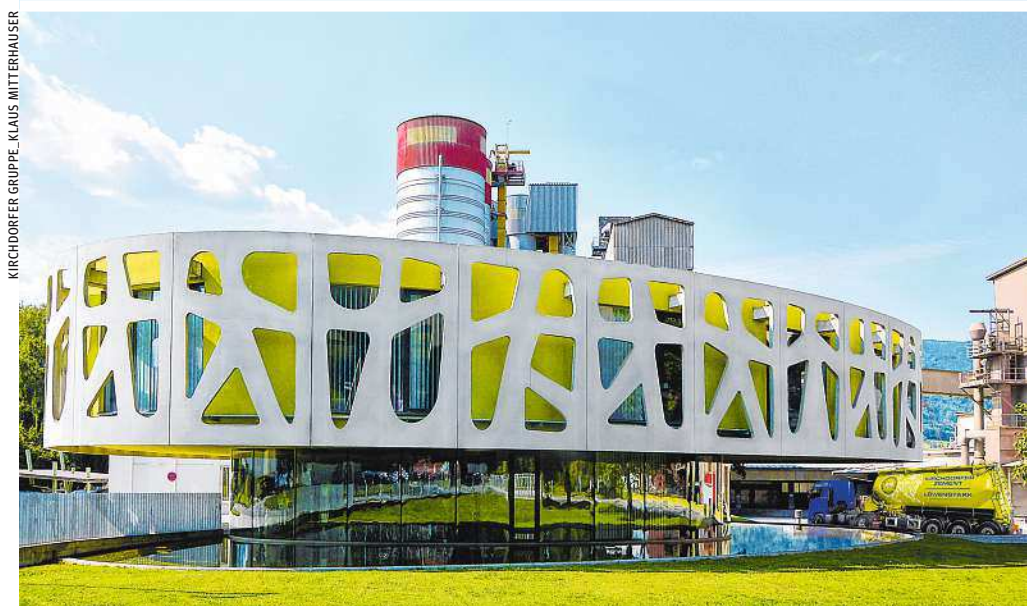
Das Kirchdorfer Zementwerk punktet nicht nur durch seine außergewöhnliche Optik. Rechts die innovative DeCONOX-Anlage, die den CO 2 -Ausstoß verringert und die Abwärme nutzbar macht