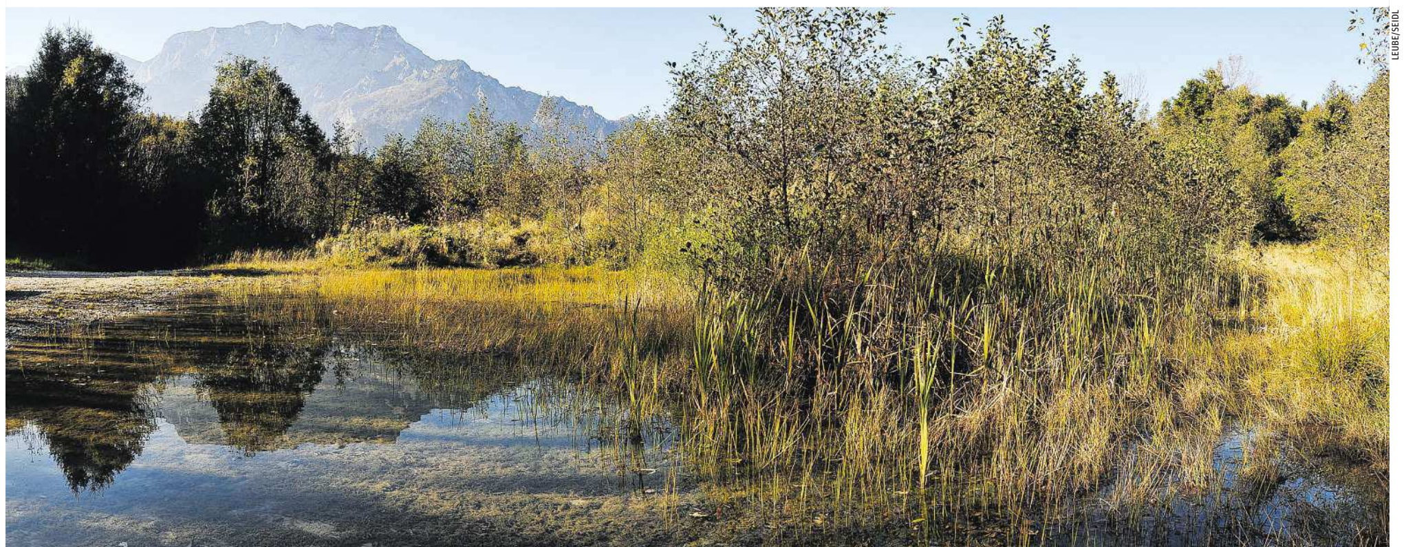
Nach ihrer Nutzung werden die Steinbrüche von Zementwerken häufig renaturiert – mit dem Ergebnis einer häufig noch höheren Artenvielfalt