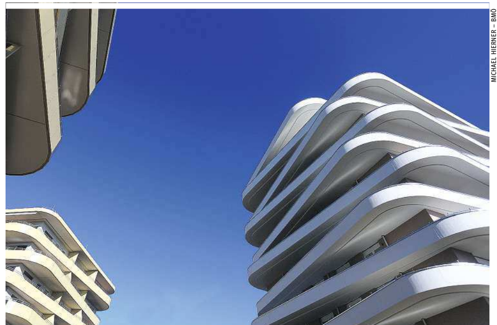
MICHAEL HERNER - BMO

die umlaufenden und gegensätzlich verdrehten Terrassen aus Beton ins Auge. Sie sind ein bis drei Meter tief und den Wohnungen vorgelagert. Um den plastischen Eindruck aus unterschiedlichen Blickwinkeln noch zusätzlich zu verstärken, sind die Brüstungen um fünf Prozent nach außen gekippt. Bei Bedarf lässt sich die Anlage noch um neun weitere Baukörper erweitern.