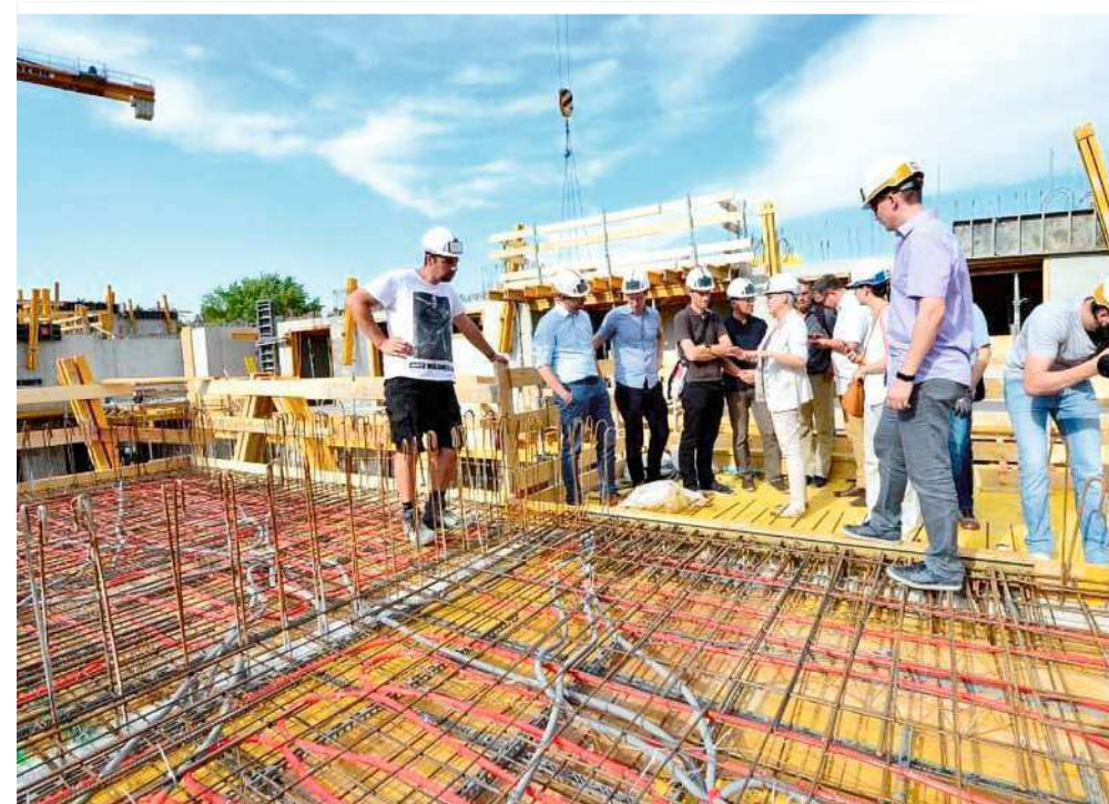
In der Mühlgasse wird erstmals die thermische Bauteilaktivierung zum Heizen und Kühlen mit Windenergie im städtischen, sozialen Wohnbau eingesetzt

schon immer getan. Doch in zwischen nutzt man diese Eigenschaft von Betonbauteilen noch bewusster. Und deshalb spricht man dabei von „Bauteilaktivierung“. Die Bauteile werden aktiviert, indem in ihrem Inneren wasserdurchströmte Kunststoffrohre verlegt werden. Durch sie