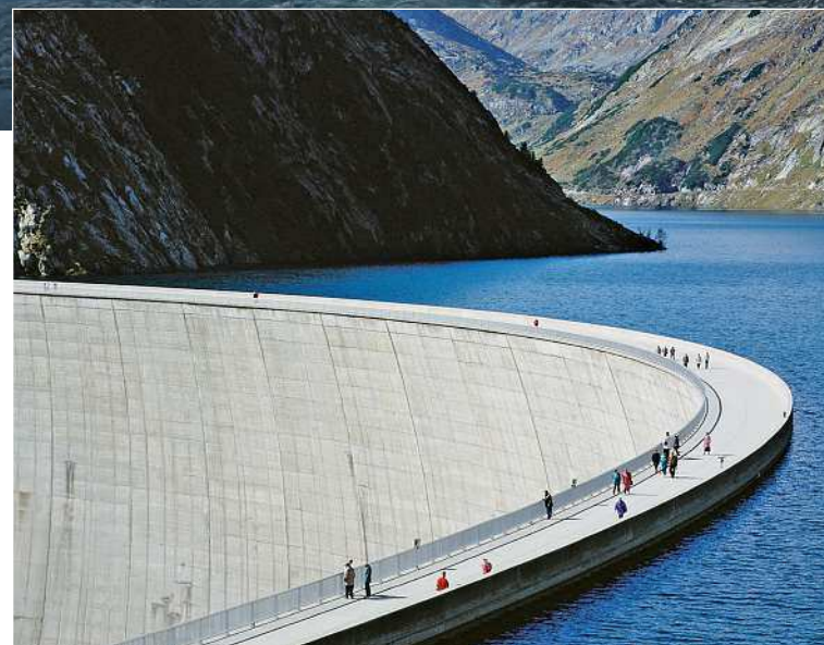
Das Kraftwerk Malta Oberstufe ist ein Pumpspeicherkraftwerk in der Ortschaft Brandstatt in der Gemeinde Malta in Kärnten, dass 1977 in Betrieb genommen wurde