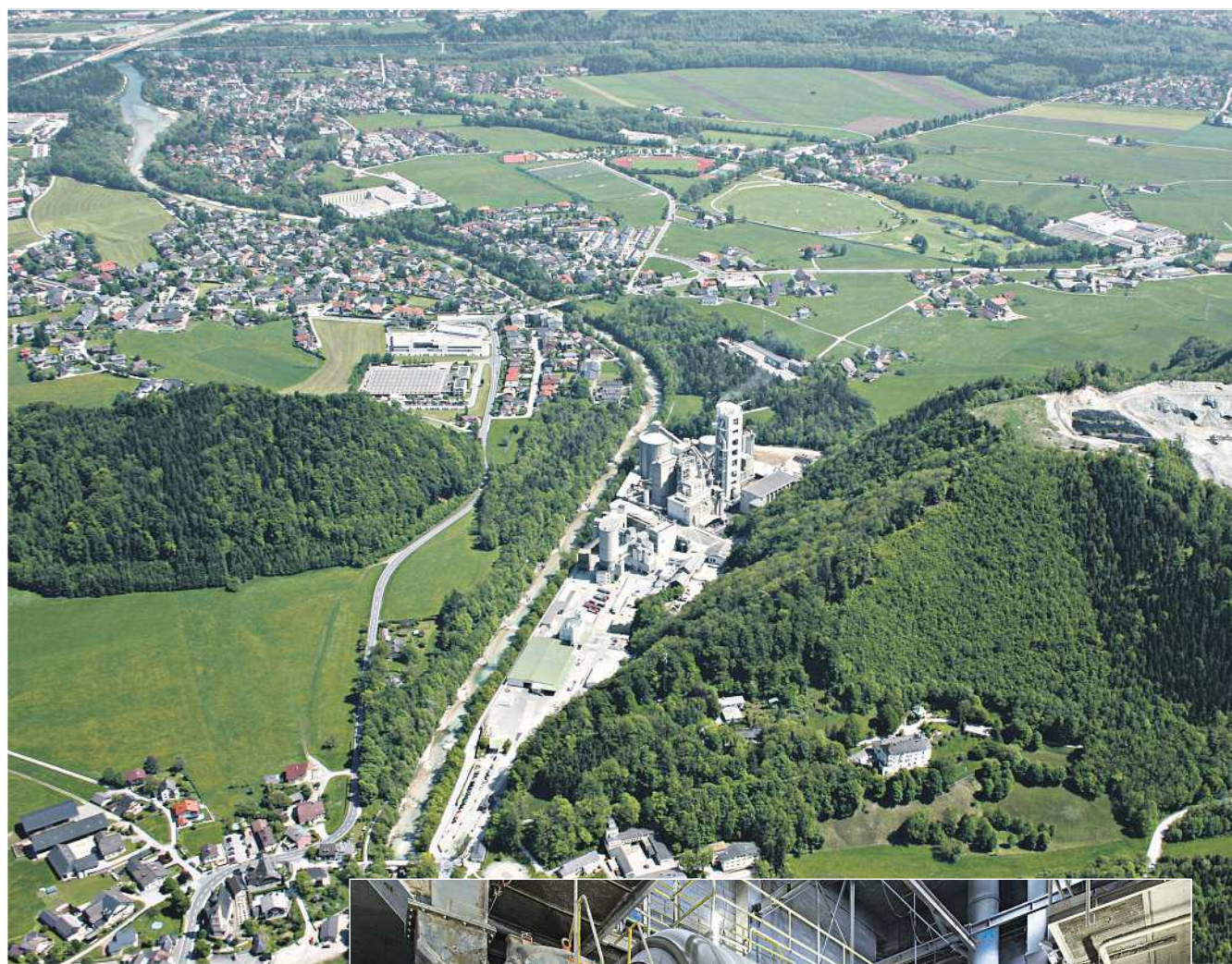
Die heimische Zementindustrie arbeitet zu einem sehr großen Teil mit Rohstoffen aus der Region. Diese werden überwiegend in nahegelegenen Steinbrüchen abgebaut.

Kombination einer guten Gebäudehülle und der Thermischen Bauteilaktivierung sorgt für ein optimales Wohlfühlklima im Haus das ganze Jahr hindurch – ohne Zugluft, ohne Temperaturschwankungen. Die Thermische Bauteilaktivierung ist ein wichtiger Schritt in die Richtung, die Energieversorgung ganzer Stadtteile umweltfreundlich zu organisieren, und kann wesentlich dazu beitragen, Städte nachhaltig mit erneuerbarer Energie zu versorgen. Für die mehrjährige Erforschung und mittlerweile bereits erfolgreiche Implementierung dieser Idee wurde die ARGE Bauteilaktivierung jüngst für den Staatspreis 2018 für