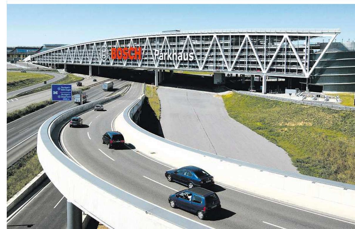
Das über eine Autobahn gebaute Parkhaus der Messe Stuttgart wurde aus Infralichtbeton errichtet