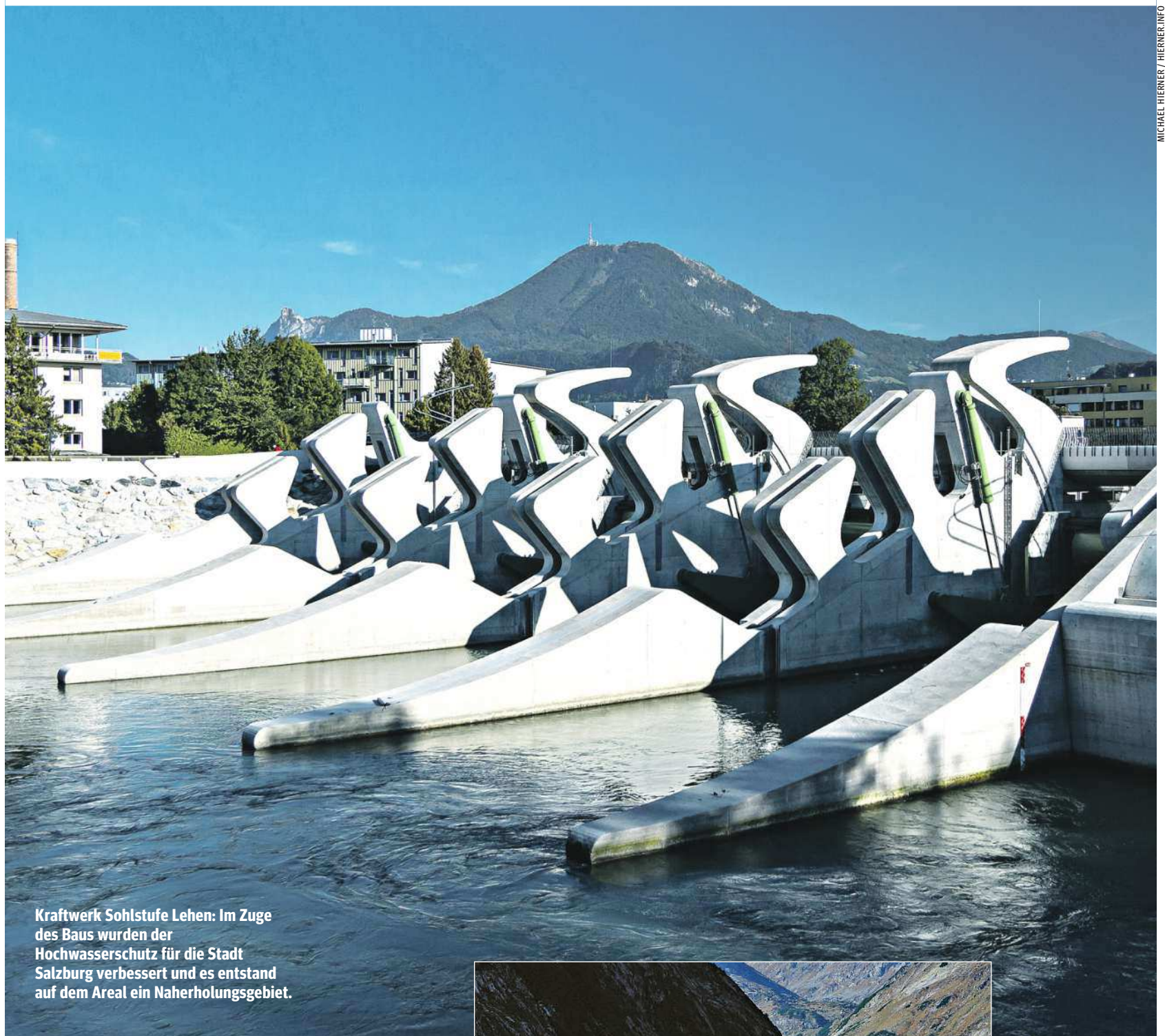
Kraftwerk Sohlstufe Lehen: Im Zuge des Baus wurden der Hochwasserschutz für die Stadt Salzburg verbessert und es entstand auf dem Areal ein Naherholungsgebiet.

Ende 2017 erzeugten in Österreich 1.260 Windkraftanlagen sauberen und umweltfreundlichen Strom für mehr als 1,9 Millionen Haushalte. 2018 kamen mehr als 60 neue Windkraftanlagen dazu. Unter anderem war es auch die Entwicklung einer neuen, hybriden Bauweise aus Beton und Stahl, die dazu beigetragen hat, dass sich die heimische Windenergie in den vergangenen Jahren so gut entwickeln konnte. Durch die Kombination aus Beton- und Stahlelementen wurde es möglich, noch höhere, leistungsstärkere Türme zu bauen. 2013 konnten im Windpark Poysdorf, die ersten hybriden Windräder österreichweit aufgestellt werden. Mittlerweile wird ein großer Teil der heimischen Windräder in dieser hybriden Bauweise gefertigt. „Windräder mit Betonturm werden aus 50 bis 60 Betonteilen zusammengesetzt. In Summe haben diese ein Betonvolumen von rund 580 Kubikmetern und eine Masse von 1450 Tonnen“, erklärt Martin Jaksch-Fliegen-schnee von der IG Windkraft Österreich. Auch das Institut für Tragkonstruktionen der TU Wien entwickelt Möglichkeiten der Aufstellung von Windrädern. Um den Transport der für den Bau benötigten Betonelemente zu vereinfachen, arbeitet man hier an leichteren Doppelwandelementen. Diese werden erst, nachdem sie zu einem Turm aufeinander gestapelt wurden, mit Beton aufge-gossen. Dadurch entsteht ein monolithischer Betonblock mit großer Stabilität.