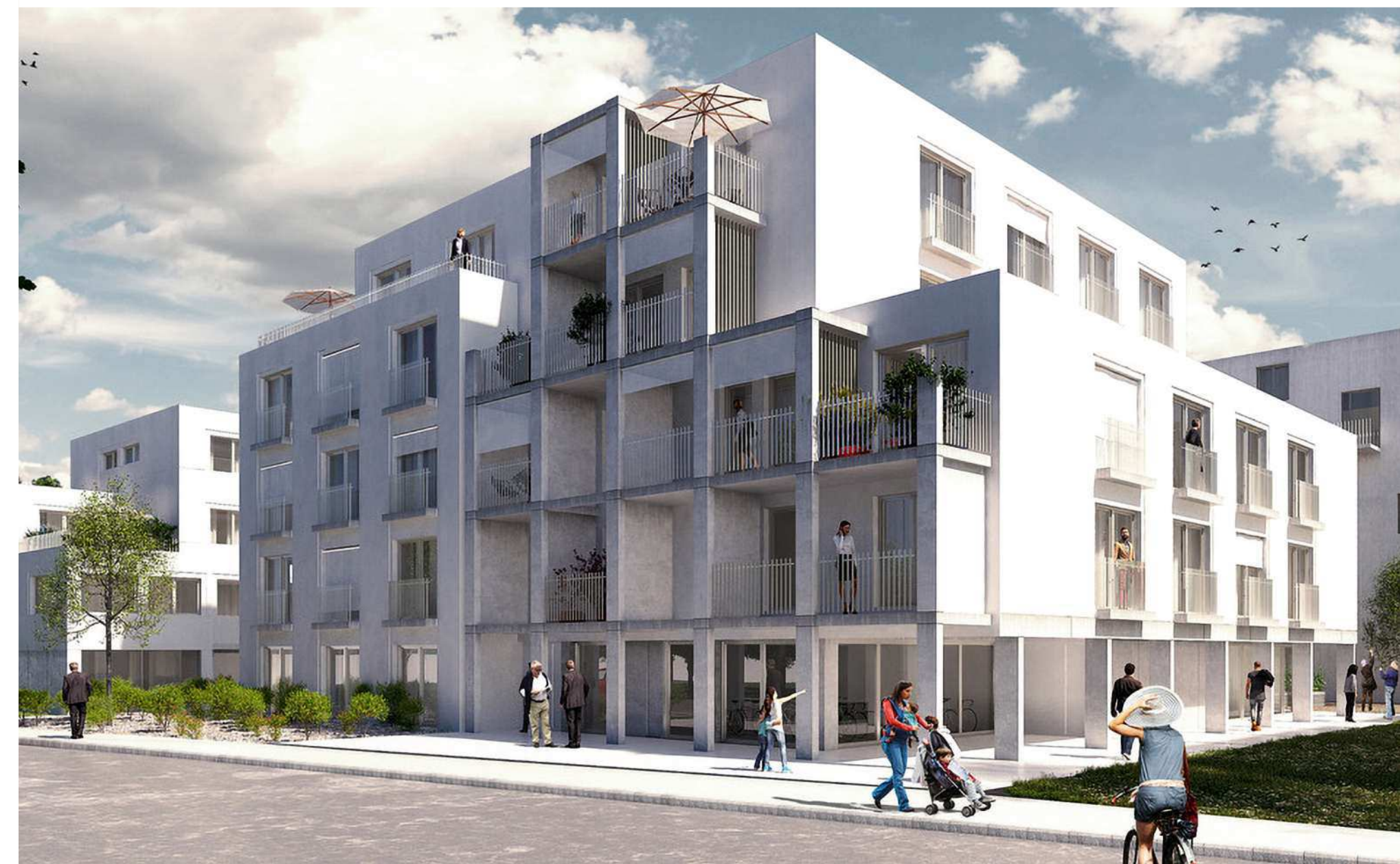
Die Wärme zum Beheizen des Gebäudes wird am Wiener Mühlgasse teilweise von Erdwärme-Tiefensonden erzeugt. 30 von ihnen wurden in rund 150 Metern Tiefe verbaut

Die Bauteile von warmem und kaltem Wasser durchströmt werden können, werden sowohl Kunststoffrohre als auch filigranere Kapillarrohmatten darin verlegt. Die nötige Wärme zum Beheizen des Gebäudes wird am Wiener Mühlgasse von Erdwärme-Tiefensonden erzeugt. 30 von ihnen wurden in rund 150 Metern Tiefe verbaut. Sie machen die Wärme in tiefergelegenen Erdschichten in kalten Wintermonaten nutzbar. Denn ab einer Tiefe von mehr als 20 Metern herrscht das ganze Jahr über eine konstante Temperatur von zehn bis zwölf Grad Celsius. Die Energie zum Betrieb der Wärmepumpen soll aus Windkraft gewonnen werden.