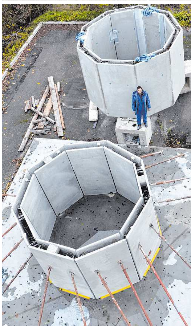
An der TU Wien wurde eine Bau-Technik für Windräder entwickelt: Große Doppelwandelemente werden mit Beton ausgegossen

Doch nicht nur im Bereich der Windenergie spielt Beton eine wichtige Rolle – schon lange werden bei der Konstruktion von Wasserkraftwerken unglaublich große Mengen des Werkstoffs verbaut. Die Maltakraftwerke in Kärnten zählen zu den größten heimischen Anlagen. Die Kölnbreinsperre, eine doppelt gekrümmte Bogenmauer, bildet das Kernstück der Kraftwerke. Mit einer Höhe von 200 Metern ist sie nicht nur die höchste Talsperre Österreichs, sondern auch eine der höchsten Bogenmauern Europas. Insgesamt kamen für den Bau der gewaltigen Sperre 1,6 Millionen Kubikmeter Beton zum Einsatz. Aufgrund ihrer beeindruckenden Größe hat sich die Sperre zu einem beliebten Ausflugsziel entwickelt. Wegen seiner außergewöhnlich spektakulären Formgebung, nimmt auch das Kraftwerk Sohlstufe Lehen eine besondere Stellung ein. Um dem Kraftwerk seine spezielle, wellenartige Form zu geben, kamen hier 40.000 Kubikmeter Beton und 3.600 Tonnen Bewehrung zum Einsatz, die in einer dreijährigen Bauphase verbaut wurden. Mit einer Leistung von 13,7 Megawatt jährlich erzeugt das Salzburger Kraftwerk rund 81 Millionen Kilowatt-