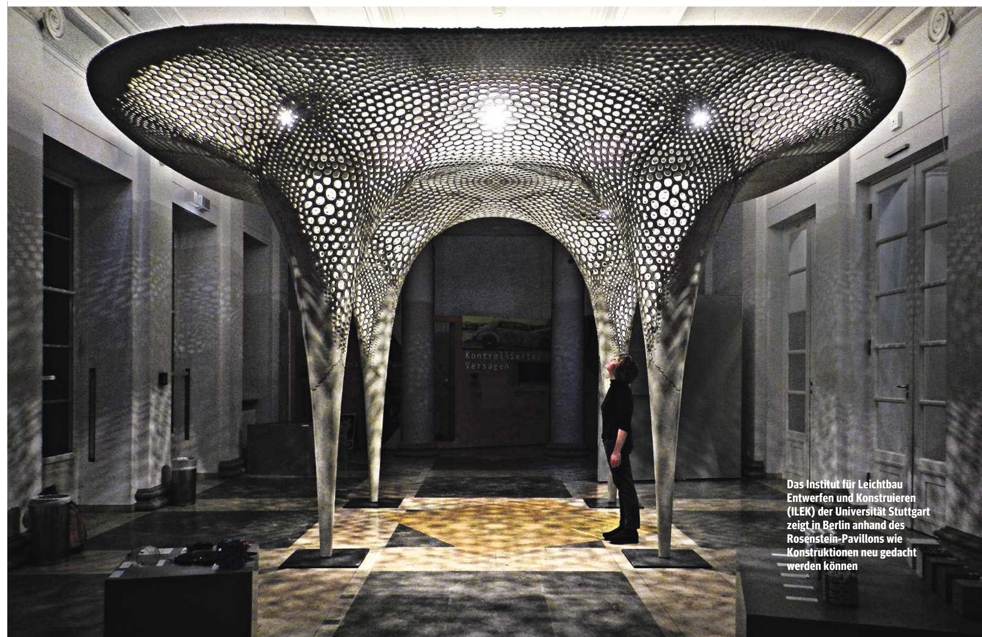
Das Institut für Leichtbau Entwerfen und Konstruieren (ILEK) der Universität Stuttgart zeigt in Berlin anhand des Rosenstein-Pavillons wie Konstruktionen neu gedacht werden können

Innovation. Ultrahochfester Beton, Beton mit Carbon-Anteil, Infralichtbeton und neue Konstruktions-Verfahren, die sich des 3-D-Drucks bedienen, sind Bereiche, in denen Entwickler aktuell forschen