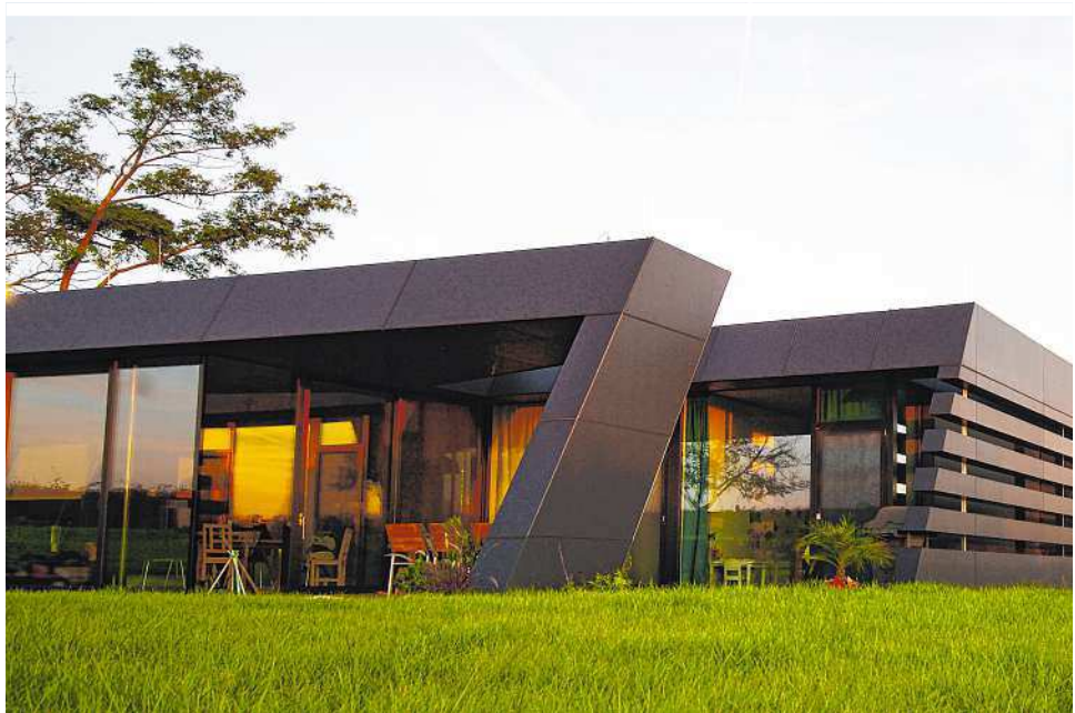
AD2 ARCHITECTEN ZT KG

ist für uns ein natürlicher Baustoff mit starkem Charakter, dessen Oberfläche sich hochwertig gestalten lässt und den Innenräumen eine wohliche Atmosphäre verleiht“, so die Architektin Andrea Dämon. Gekonnt haben sich die Architekten die Bauteilaktivierung zur Heizung und Kühlung des Gebäudes zunutze gemacht und die ideale Lösung für die Behaglichkeit gefunden.