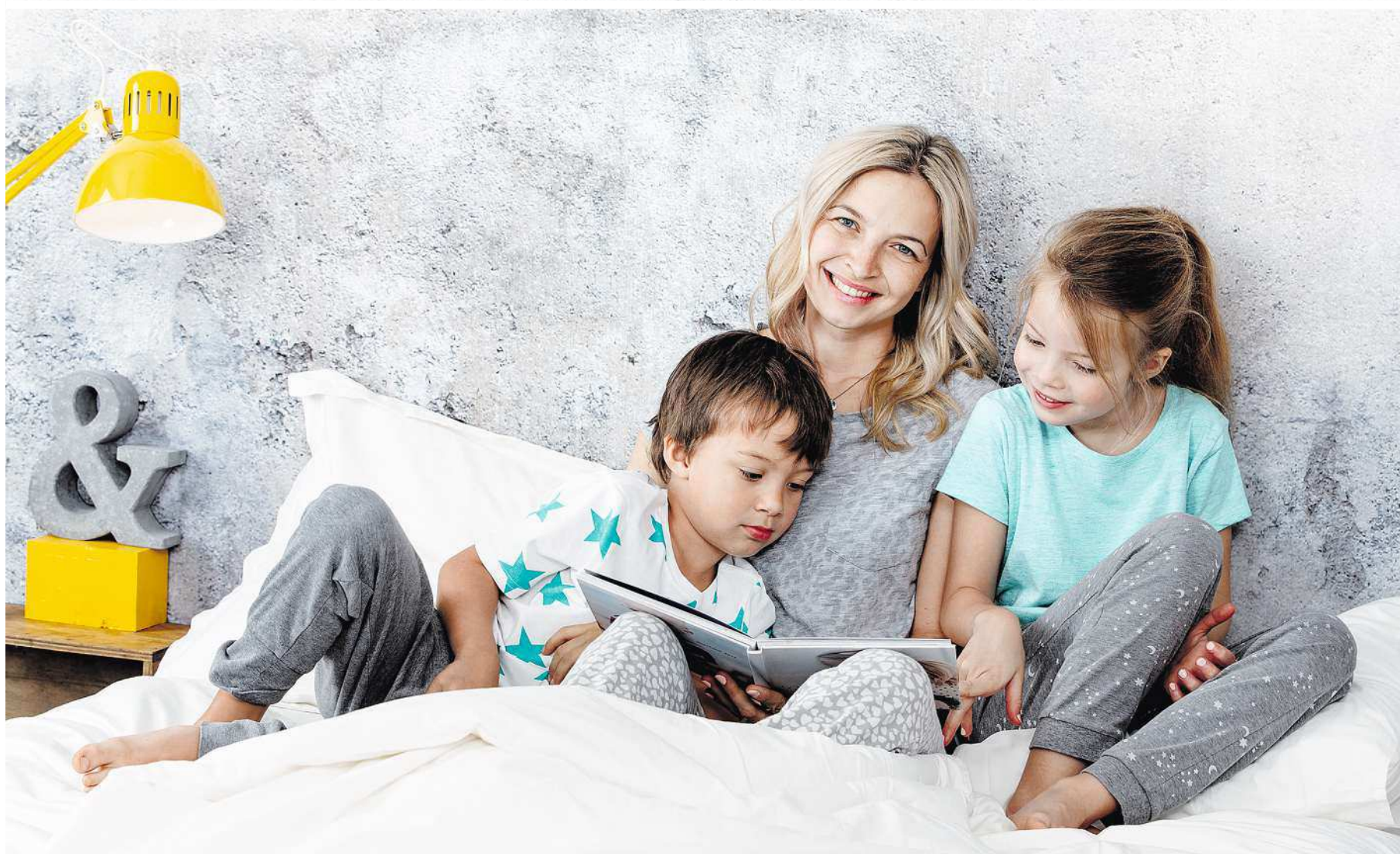
Der Lieblingsbaustoff vieler Ingenieure und Architekten verwöhnt beim Wohnen mit angenehmer Raum Atmosphäre