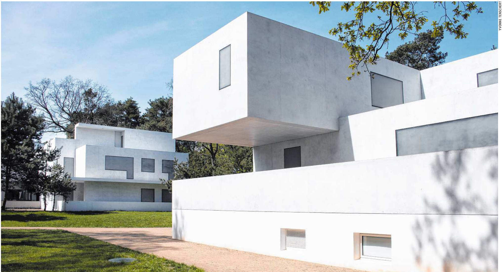
Auf heimischen Baustellen kommt eine Vielzahl unterschiedlicher mineralischer Baustoffe zum Einsatz

Werkstoff. Beton ist nicht gleich Beton. Er unterscheidet sich vor allem nach Einsatzgebiet