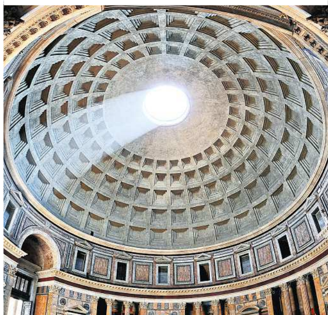
Das Pantheon in Rom stammt aus dem zweiten Jahrhundert n. Chr. und hatte mehr als tausend Jahre die größte Kuppel aus Beton

Die Entwicklung neuer Einsatzgebiete für Beton scheint auch Jahrtausende nachdem er das erste Mal auf Baustellen zum Einsatz kam, nicht abgeschlossen. Das macht das allgegenwärtige Material bei all seiner Festigkeit und Stabilität zu einem flexiblen und dynamischen Werkstoff mit immer mehr Möglichkeiten. Und schön anzusehen ist er auch.