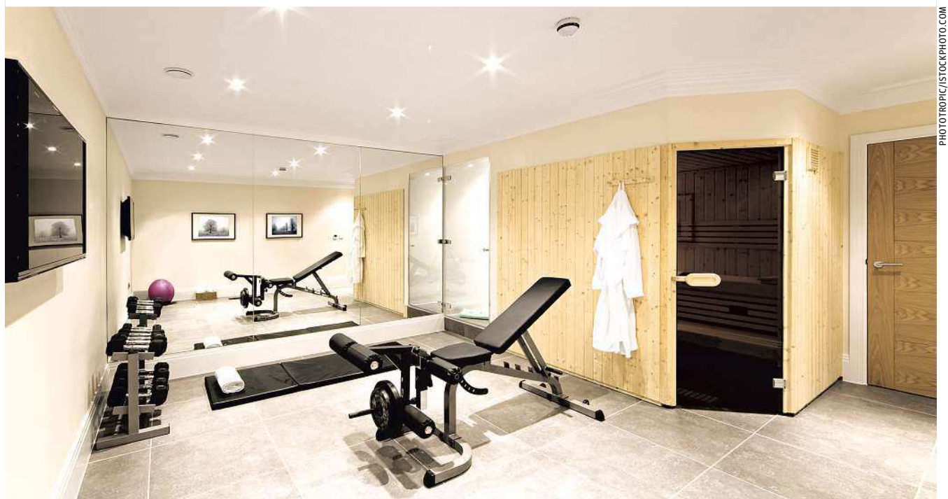
Ein Keller verhilft zu jeder Jahreszeit zu einem angenehmen Wohnklima und bietet deutlich mehr nutzbaren Raum