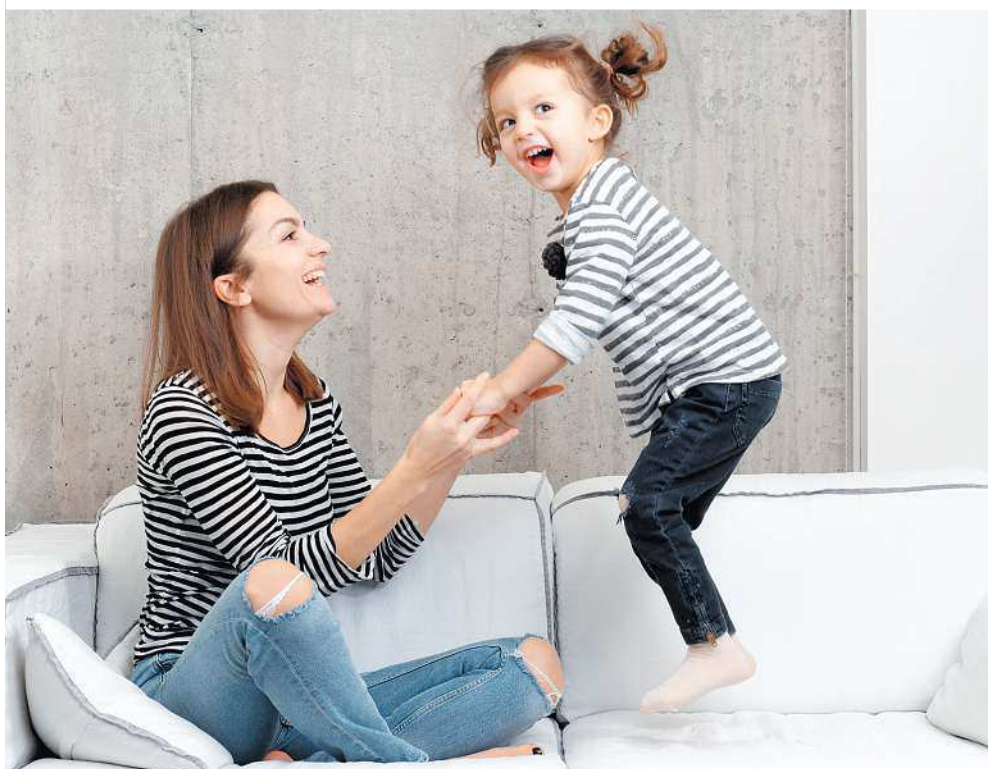
Mit Beton lässt sich thermisch dämmen, um so für die ideale Wohlfühltemperatur zu sorgen

Noch immer denken viele beim Klang des Wortes „Sichtbeton“ eher an die graue Tiefgarage statt ans helle und freundliche Wohnzimmer. Dabei muss Sichtbeton gar nicht grau sein und die Farbpalette von Beton ist so vielfältig wie die Möglichkeiten bei der Oberflächenstruktur. In mehr als 150 Farbtönen lässt sich Beton anmischen. Dabei werden ihm aus Mineralien gewonnene Farbpigmente zugefügt. Im Gegensatz zu Beton, der einfach bemalt oder lackiert wurde, verleihen die Pigmente nicht nur der Oberfläche die gewünschte Farbe, sondern dem gesamten Material, das seine Farbe dementsprechend auch an abgeriebenen oder abgestoßenen Stellen behält – ganz im Gegensatz zum Beispiel zu tapezierten Wänden. Doch gerade gestalterische Puristen verzichten gern auf farbliche Extravaganzen im Beton. Sie schätzen häufig das Grau von Beton als Statement für Natürlichkeit und Ehrlichkeit und Beton wird einfach gern gesehen.