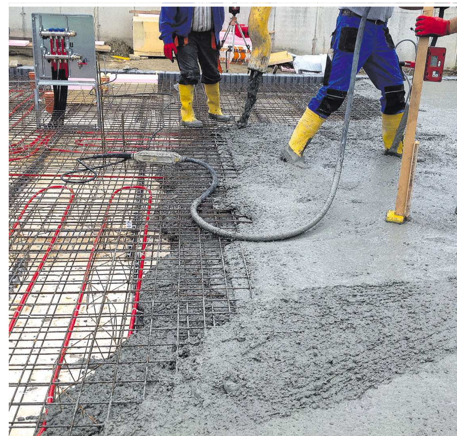
Die Betonbranche arbeitet in Österreich sehr regional – der durchschnittliche Transportradius liegt bei rund 35 Kilometern

und keramischen Industrie mit der Herstellung von Baustoffen und Produkten für das Baunebengewerbe, davon allein 1385 Beschäftigte in Unternehmen der Transportbeton-Produktion, knapp 1200 in der Zementindustrie und 2775 in der Beton- und Betonfertigteil-Herstellung. Dabei bietet die Branche auch vielen älteren Arbeitnehmern einen sicheren Arbeitsplatz. So ist rund ein Drittel der Beschäftigten in der Massivbaustoff-Herstellung 50 Jahre alt oder älter.