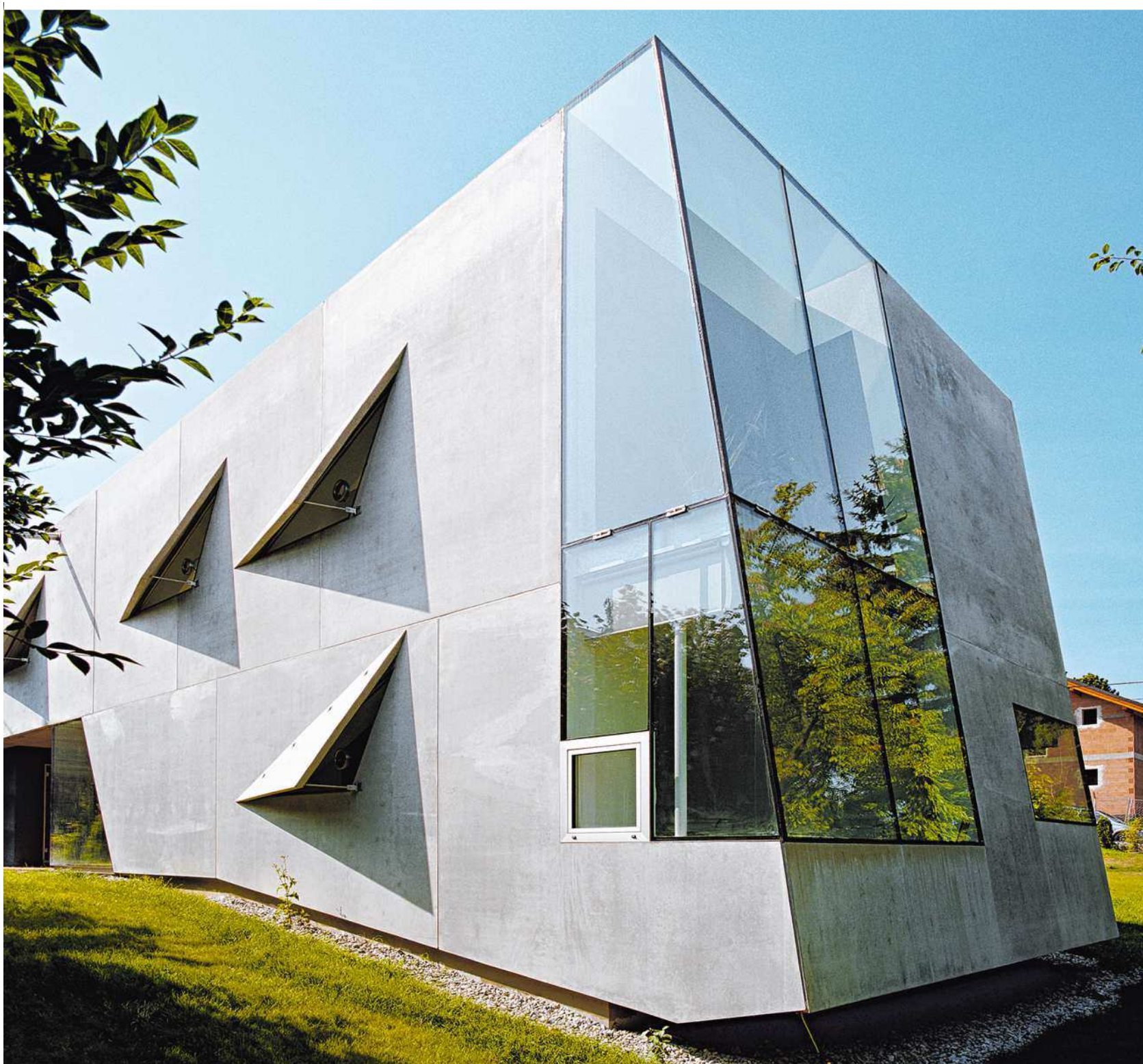
Beton – kaum ein anderer Baustoff lässt sich im Wohnbau auf solch universelle Weise verlässlich und dauerhaft einsetzen

Dabei profitieren Architekten, die mit Beton als Werkstoff planen, auch von Neuentwicklungen der Beton- und Zementindustrie. Zum Beispiel von sogenanntem Infralichtbeton. Darunter versteht man sehr leichte Betone, die gleichzeitig eine tragende Rolle spielen können,